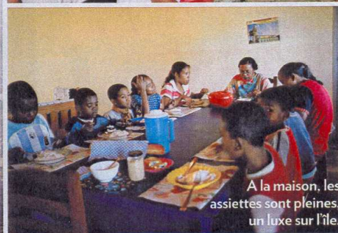
A la maison, les assiettes sont pleines, un luxe sur l'île.