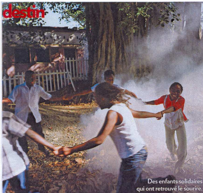
Des enfants solidaires qui ont retrouvé le sourire.