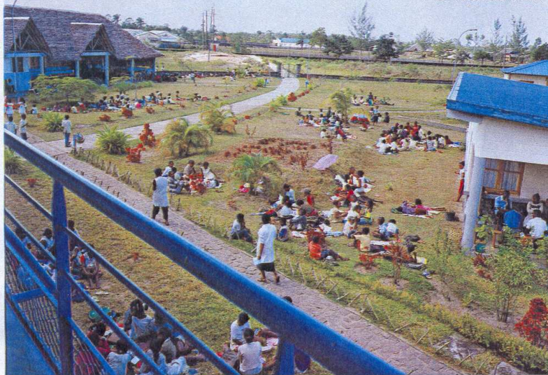
Pique-nique au village d'enfants avant le départ en vacances d'été.